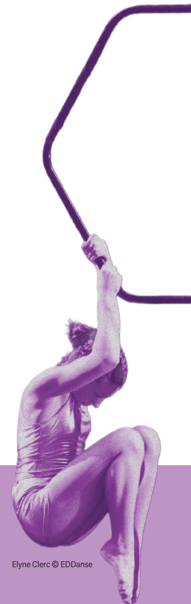
Elyne Clerc

Vincent Regnault et Elyne Clerc offriront une prestation à couper le souffle, mêlant flying pole et lollipop.