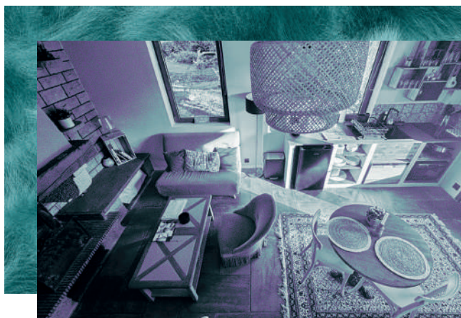
© À la conquête de l'Est