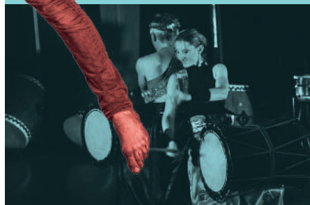
Kichigai Taiko