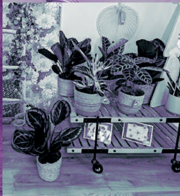
© À la conquête de l'Est

Voilà. Pas besoin de classement étoilé : juste des adresses qui font vibrer.